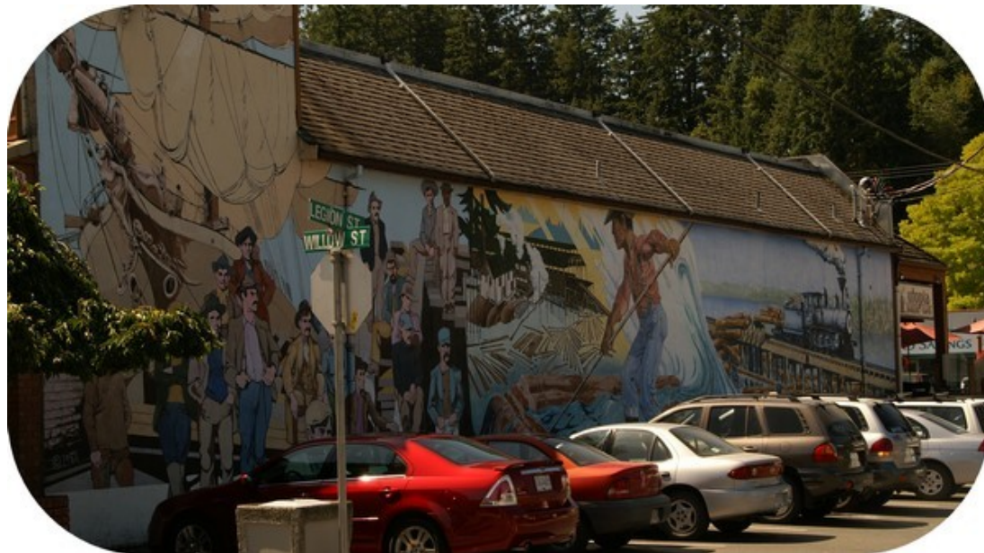
Vægmalerier i Chemainus.