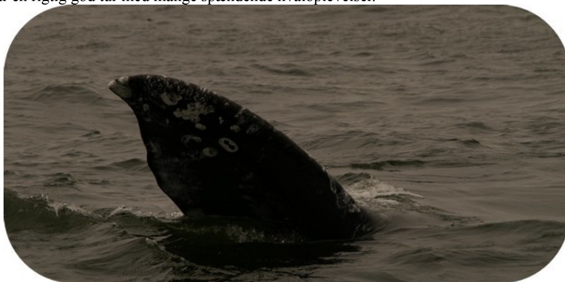
Afsked med gråhvalen, den vinker til os med den ene luffe.

Det var en rigtig god tur med mange spændende hvaloplevelser.