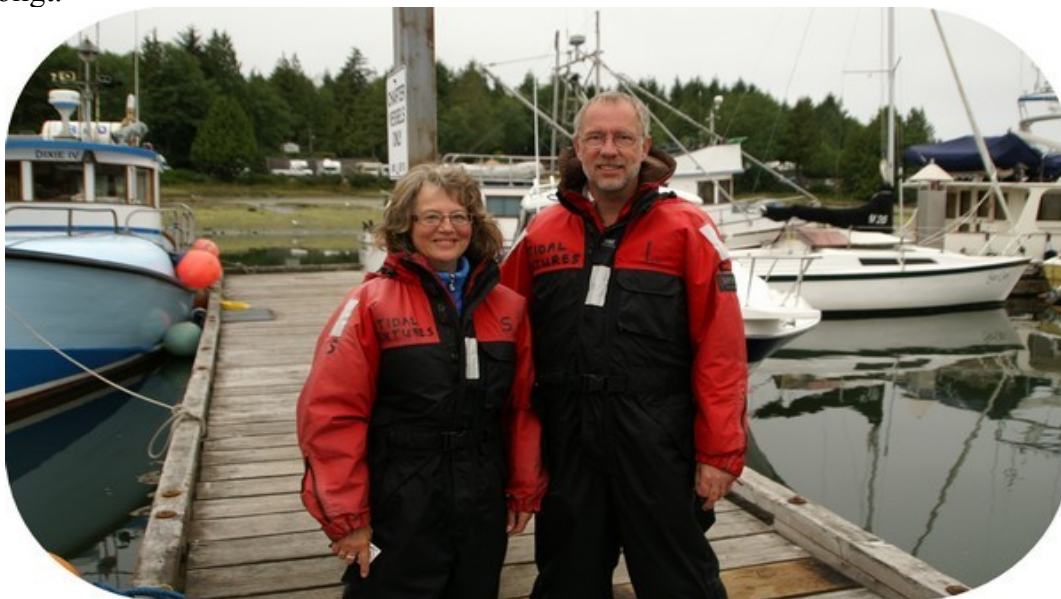
Klar til afgang, iklædt Helly Hansen dragter.

I løbet af onsdag aften og nat kom havgusen ind og lagde en dyne af kulde og tåge over landskabet. Vi hørte også tågehornet natten igennem, og heldigvis var havgusen lettet til morgen, men det var stadig køligt.