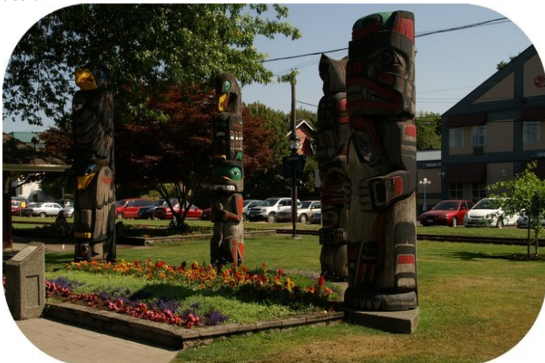
Totempæle i Duncan.