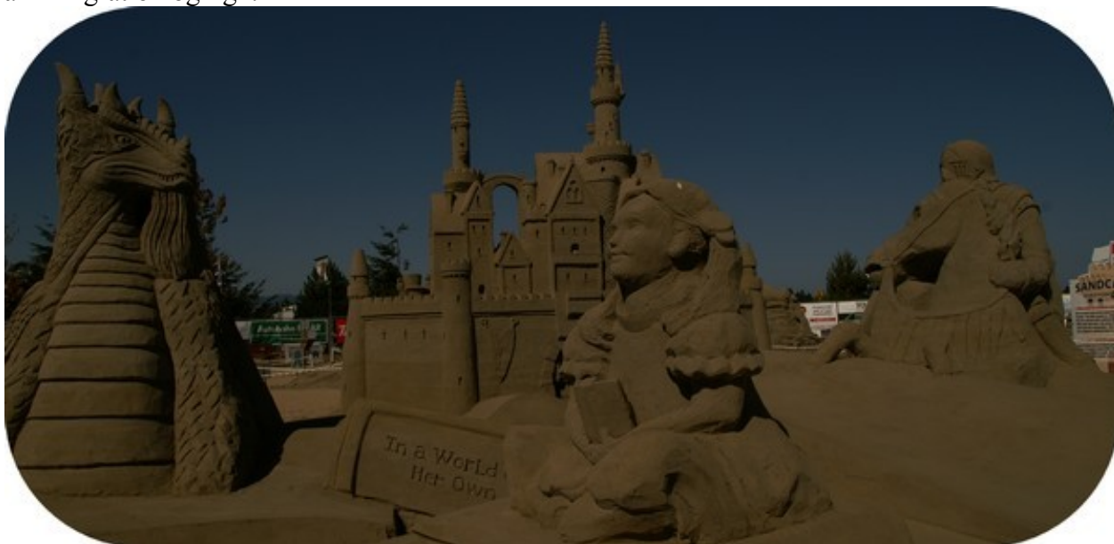
Imponerende sandskulpturer ved Parksville.

Vi pakkede vognen og var klar til at køre fra pladsen ved 9-tiden, men en canadier holdt i vejen for os, han var ved at koble bilen til camperen, og det tog bare lang tid. Vi nåede på toilet i ventetiden. Så blev han klar til at køre, men kørte kun få meter, så var han ud for dump-tanken, og ville da lige tømme camperens toilettank og hælde frisk vand på. Og vi høflige danskere holdt bare stille og ventede. Vi forlod pladsen efter alt tomulten, og kørte i retning mod Departure Bay (Nanaimo), vi ville med færgen til Horseshoe Bay nord for Vancouver. Ved Parksville kørte vi helt ned til vandet, og der var en offentlig camper parkeringsplads få meter fra vandet. Det var for koldt til at sidde stille, vi havde taget tæppet med, men opgav vores forehavende. Vi så skilte med Beach Festival, og gik nærmere for at se, hvad det var. Det viste sig at være sandskulpturer, lige som vi ser dem ved Vesterhavet om sommeren. Skulpturerne var meget fantasifulde og flotte, utroligt hvad man kan forme i sand. Ved et kort, overplastret med knappenåle, beregnet på at gæsterne kunne markere, hvor de kom fra, satte vi selvfølgelig også vores hjemstavn på. Et britisk, men nu canadisk boende ægtepar snakkede til os, de var flyttet til Canada for mange år siden, de var glade ved at bo i Canada, da økonomien er god i Canada, og myndighederne har styr på tingende, her tænkte de mest på immigration og lign.