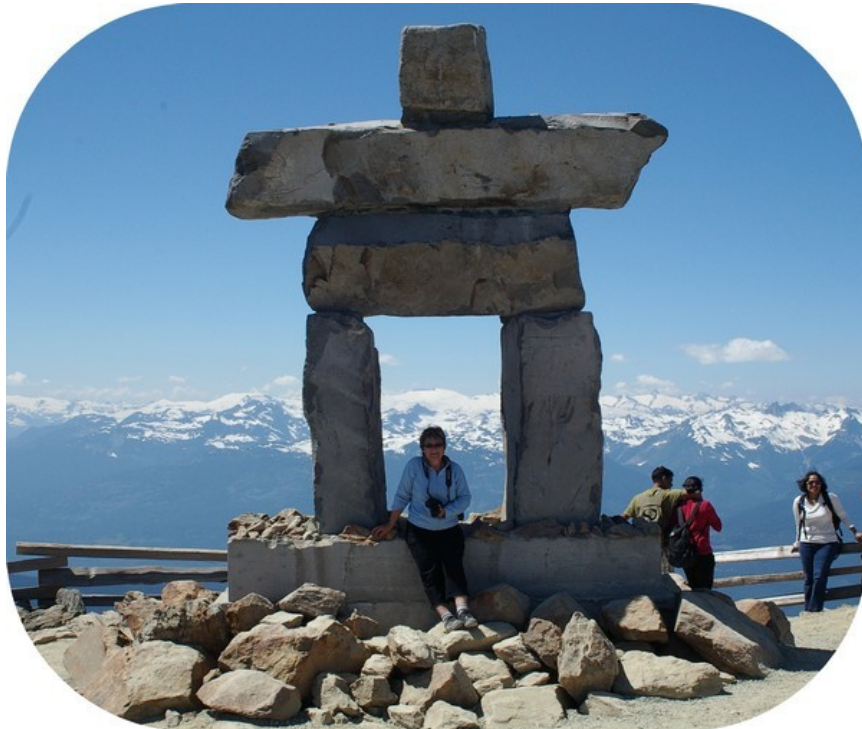
Inukshuk på Whistler Mountain.